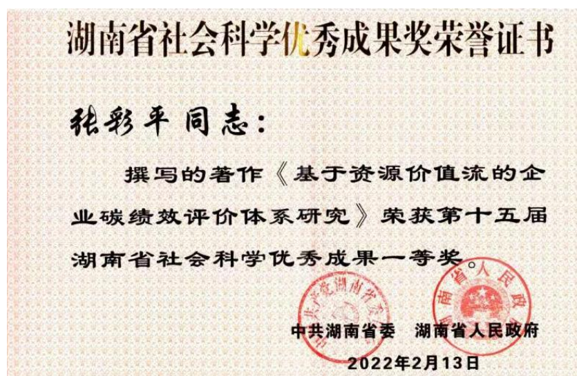
图3 第十五届湖南省社科优秀成果一等奖

近三年来，会计系教师主持省部级科研立项 9 项，其中省部级重点课题 4 项；发表高质量科研论文 36 篇，获得湖南省社会科学优秀成果奖一等奖 1 项，湖南省会计科研成果一等奖 2 项；湖南省级教改课题立项 3 项，发表高质量教改论文 7 篇，湖南省教育教学成果三等奖 1 项，教育部产学研合作项目 1 项，省级教学比赛二等奖 2 项，三等奖 1 项。