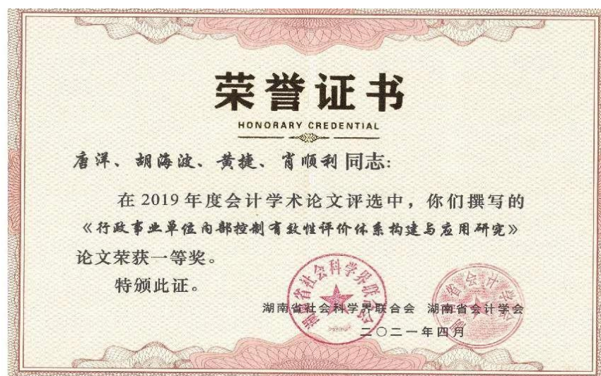
图4 湖南省会计科研成果一等奖