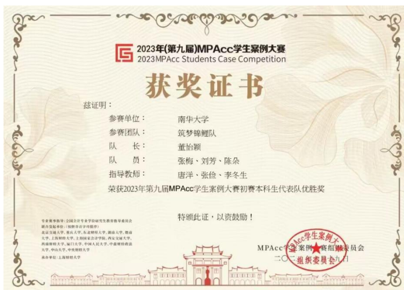
图6 2023年第九届MPAcc学生案例大赛本科生组全国第1名

近三年，指导会计学专业学生成功申报国家级创新创业项目2项，省级创新创业项目11项，累计发表科研论文12篇。学生在全国MPAcc学生案例大赛、挑战杯竞赛、财务大数据、财务机器人（RPA）技能竞赛、“互联网+”大学生创新创业大赛等比赛获奖29项，其中本科生4支队伍获得全国MPAcc学生案例大赛本科生组“全国二十强”（目前共有6支队伍获奖，湖南省高校排名第一，全国排名第五）。近三年，共有73名同学到湖南大学、中南大学、中南财经政法大学、暨南大学、上海国家会计学院、上海财经大学、利兹大学、英国南安普顿大学等高校继续读研深造。