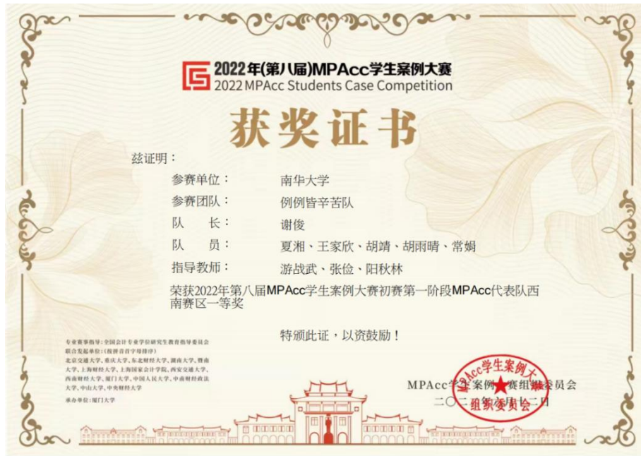
图 7 2022 年第八届 MPAcc 学生案例大赛西南赛区一等奖