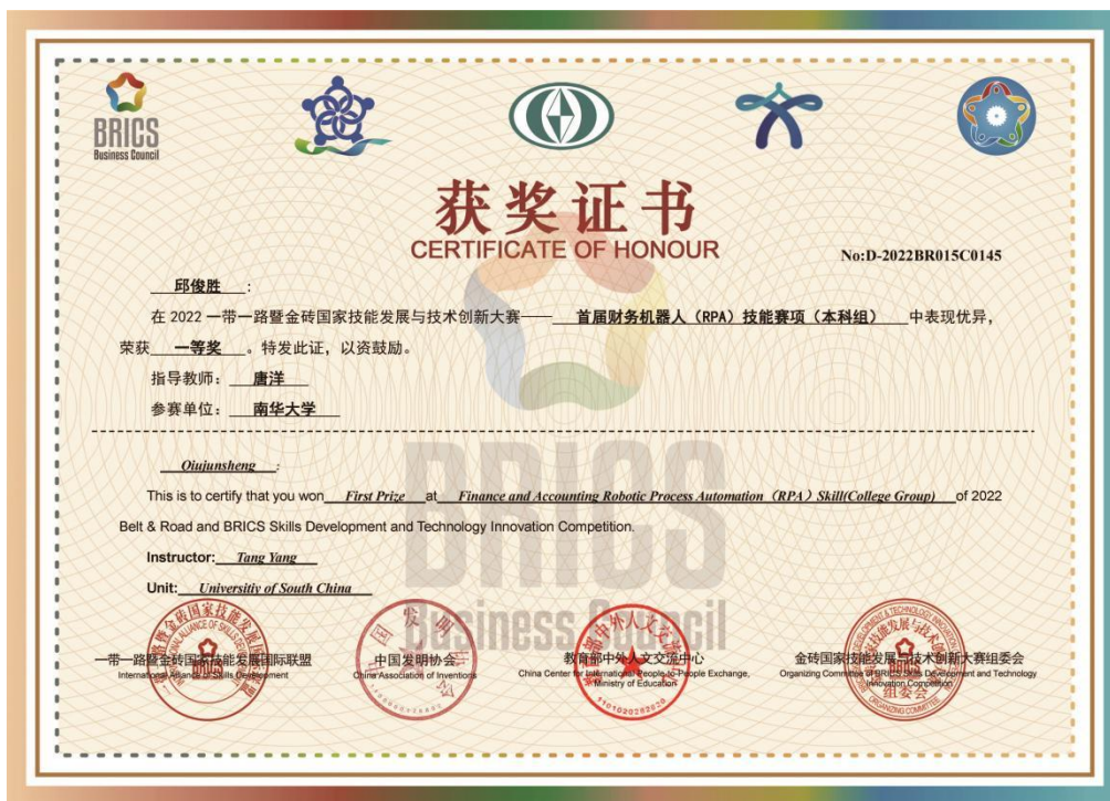
图 8 2022 年全国财务机器人（RPA）技能大赛一等奖