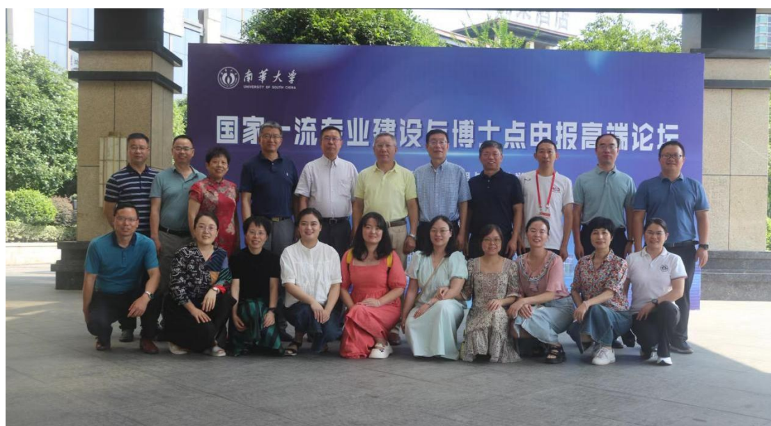
图 2 会计学专业国家一流专业建设论坛